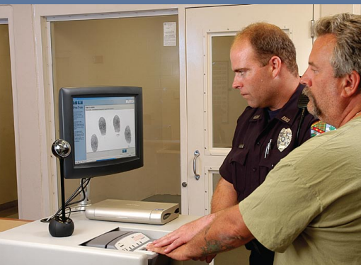
Sistema PrisTrak siendo utilizado en una prisión para rastrear a prisioneros

Con PrisTrak, evite Incertidumbres relacionadas a identidad a través del ciclo de un presidiario y descanse seguro que la persona equivocada no será liberada