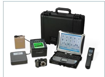
Guardian R Multimodal Jump Kit