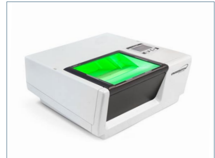
L SCAN 500P