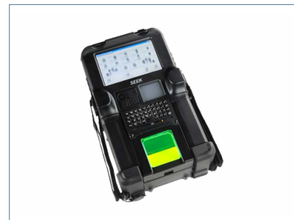
SEEK® II - Secure Electronic Enrollment Kit