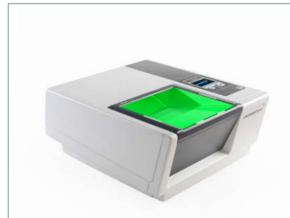
L SCAN® 1000PX