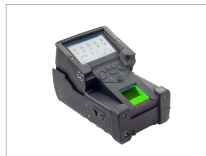
SEEK - Secure Electronic Enrollment Kit